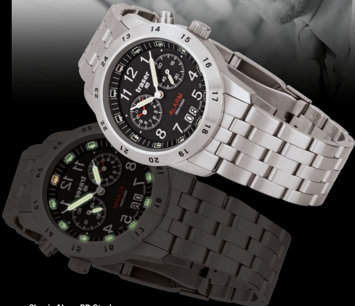
Classic Alarm BD Steel

«I read my traser ® H3 watch in a blink of an eye»