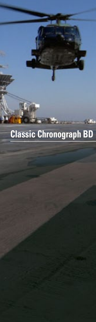
Classic Chronograph BD

Our popular Chronograph BD is also available in solid Titanium construction. A very stylish model that offers multiple time keeping functions and still feels light on your wrist. Try this watch on, appreciate its look and cutting edge illumination technology..... you'll likely never take it off again!!